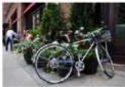
ブルックリンの中心地に、最新のラグジュアリーホテル。クラシックとモダンが融合したデザインが特徴的。

ホテルのすぐそばに公園があり、散歩やジョギングに最適だ。また、ホテル内にはカフェやレストランもあり、快適な滞在が楽しめる。このホテルは、ブルックリンの歴史的な背景を大切にし、最新のラグジュアリーホテルとしての魅力を発揮している。