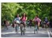
公園内には、多くの自転車道があり、家族連れや友人と楽しむのに最適な場所である。

輝 「輝」は、光を放つこと。この季節、公園の緑が美しい。自転車も人気。この季節、公園の緑が美しい。