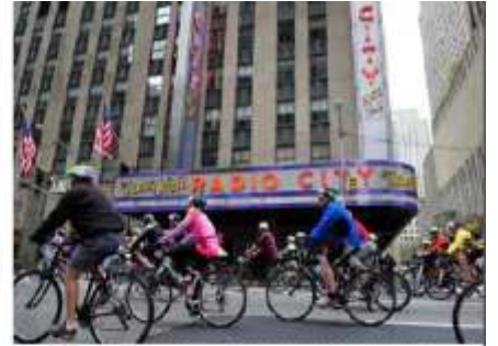
マンハッタンを走るサイクリストたち。背景には、マンハッタンを走るサイクリストたち。

今 毎年5月第1日曜日にニューヨークで開催される最大の自転車イベント、サイクリング・ツアー。マンハッタンを走るサイクリストたち。背景には、マンハッタンを走るサイクリストたち。