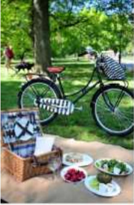
ピクニックが人気のセントラルパーク。自転車も人気。この季節、公園の緑が美しい。自転車も人気。この季節、公園の緑が美しい。