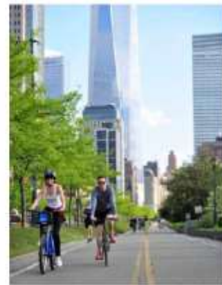
ブルックリンの中心地に、最新のラグジュアリーホテル。クラシックとモダンが融合したデザインが特徴的。

ひ ブルックリンの中心地に、最新のラグジュアリーホテル。クラシックとモダンが融合したデザインが特徴的。