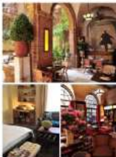
ブローoklynの中心地に、最新のラグジュアリーホテル。クラシックとモダンが融合したデザインが特徴的。

The Greenwich Hotel www.thegreenwichhotel.com