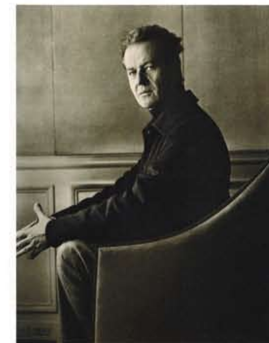
L'hôtel The Mark à New York. The Mark Hotel in New York.